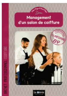
Un livre Management d'un salon de coiffure Editions : LE GENIE Editeur ISBN : 9782375630822